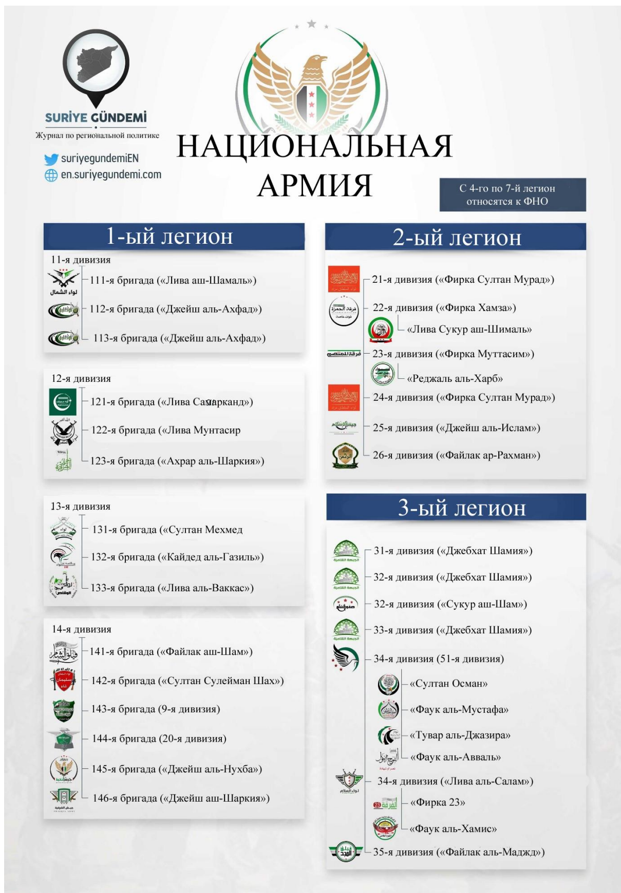
Рис. 3: Состав СНА по фракциям