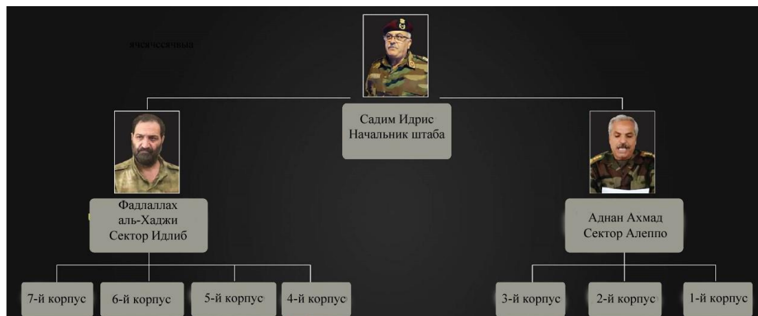
Рисунок 2. Иерархия СНА

В таком составе на 2017 год СНА осуществила слияние с силами ФНО в 2019 году. ФНО был образован в провинции Идлиб в мае 2018 года из 11 фракций Свободной сирийской армии. После слияния СНА расширилась до семи корпусов: три из них сохранились от состава Национальной армии на 2017 год, а еще четыре были сформированы из отрядов Фронта национального освобождения. Сирийский национальный совет (СНС) –